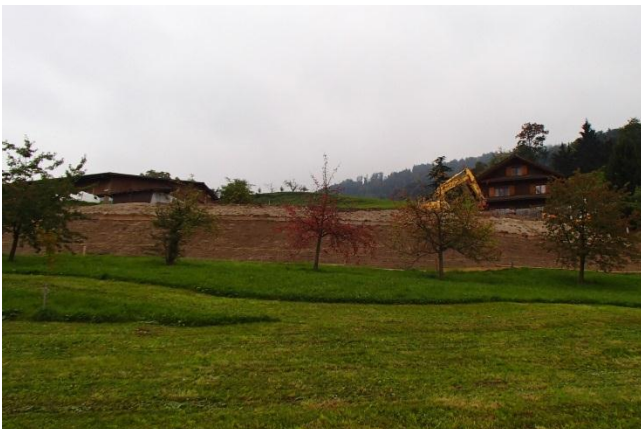
Blick hangaufwärts, während der Aufschüttungsarbeiten.