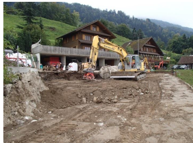
Das Aufschüttmaterial wird schichtweise eingebaut und verdichtet.