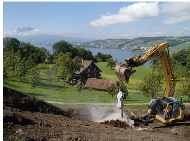
Um die Bodenkennwerte zu erhöhen, wird dem Schüttmaterial ein Kalk-Zement-Gemisch zugegeben...