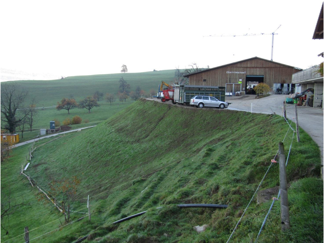
Situation ca. 4 Wochen nach Abschluss der Erdarbeiten.