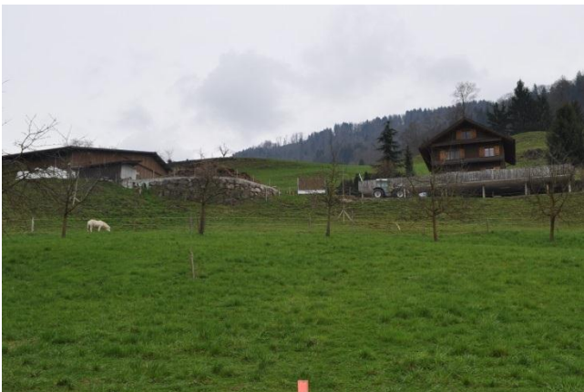
Blick hangaufwärts; ursprüngliche Geländesituation.