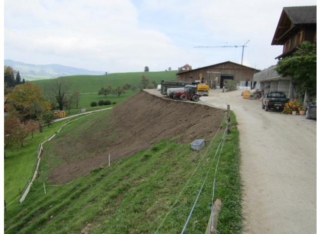
Fertige Aufschüttung bei Abschluss der Arbeiten.