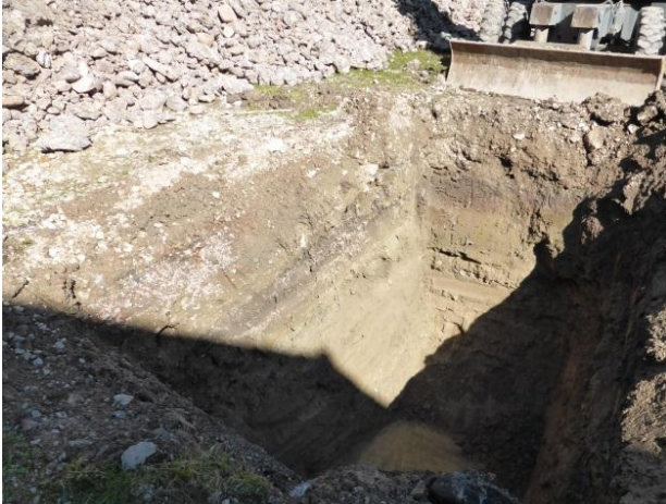
Baggerschacht im Rahmen der vorgängigen Baugrunderkundung.