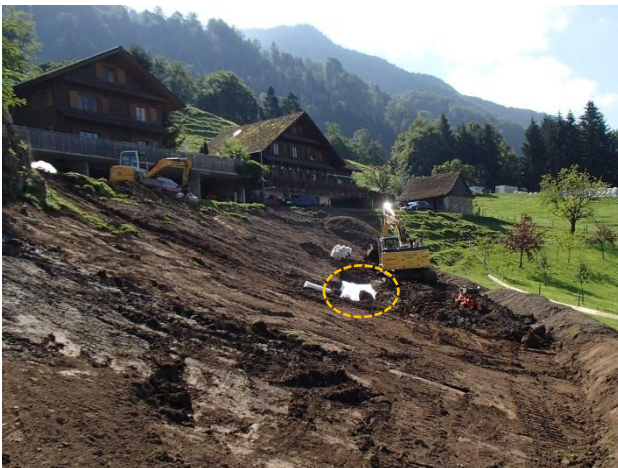
Vorbereiten der Sohlfläche vor Erstellung der Aufschüttung. (Kreis: Drainageschicht)