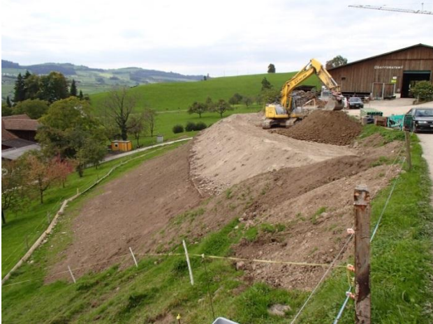
Seitenansicht der fast fertigen Aufschüttung.