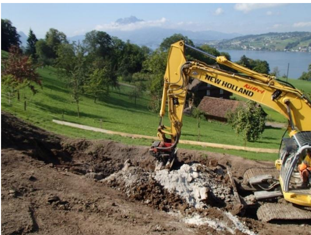
...und während des Aufschützens vor Ort mit Bagger untergeschichtet.