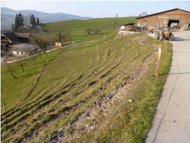
Blick von der Seite; ursprüngliche Geländesituation.