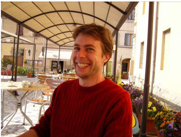
Dolce fa niente