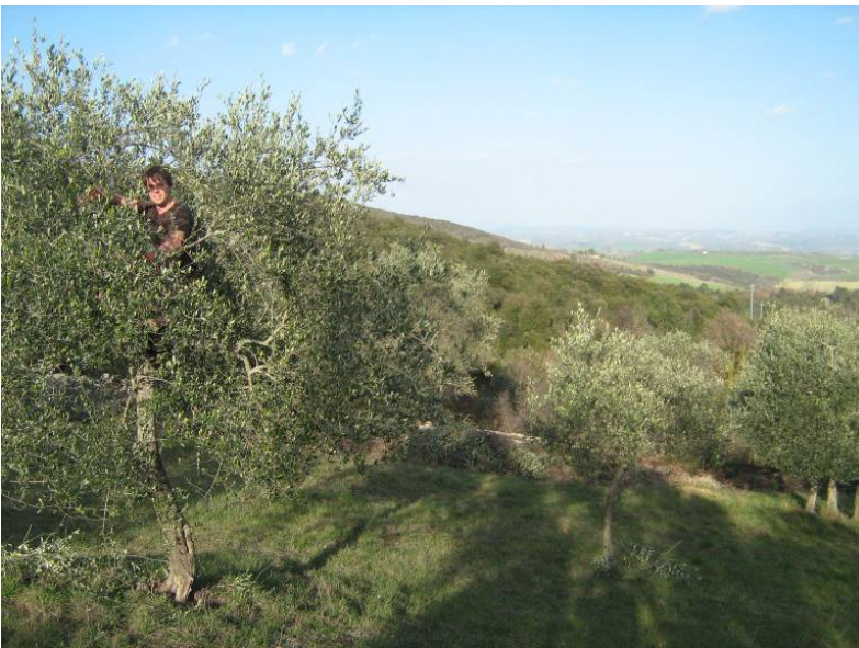
Peer im Olivenbaum