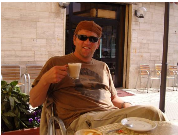
Il Capo con Latte macchiato