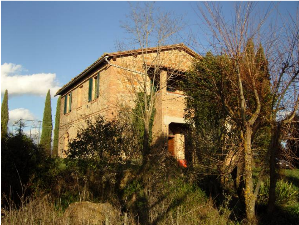
Das Haus „Podere Quado“ im Etruskerland bei Murlo