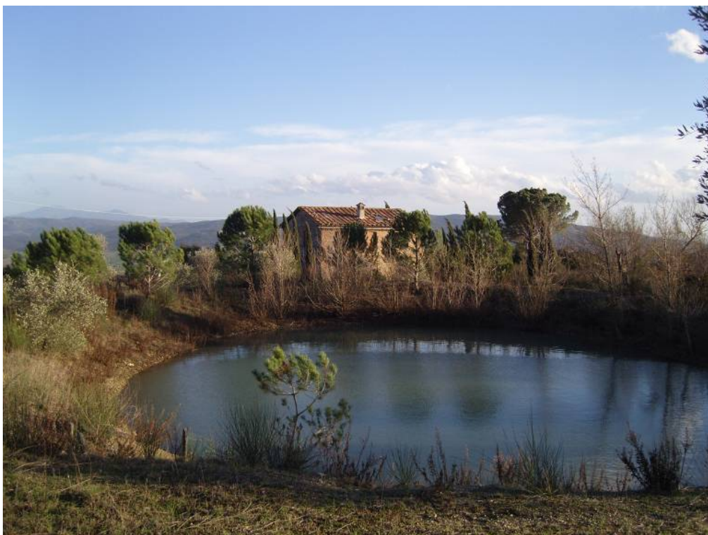
Reiseziel ½ Stunde südlich von Siena