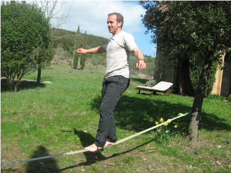
Nicht nur bei der Arbeit muss man Balance finden/halten