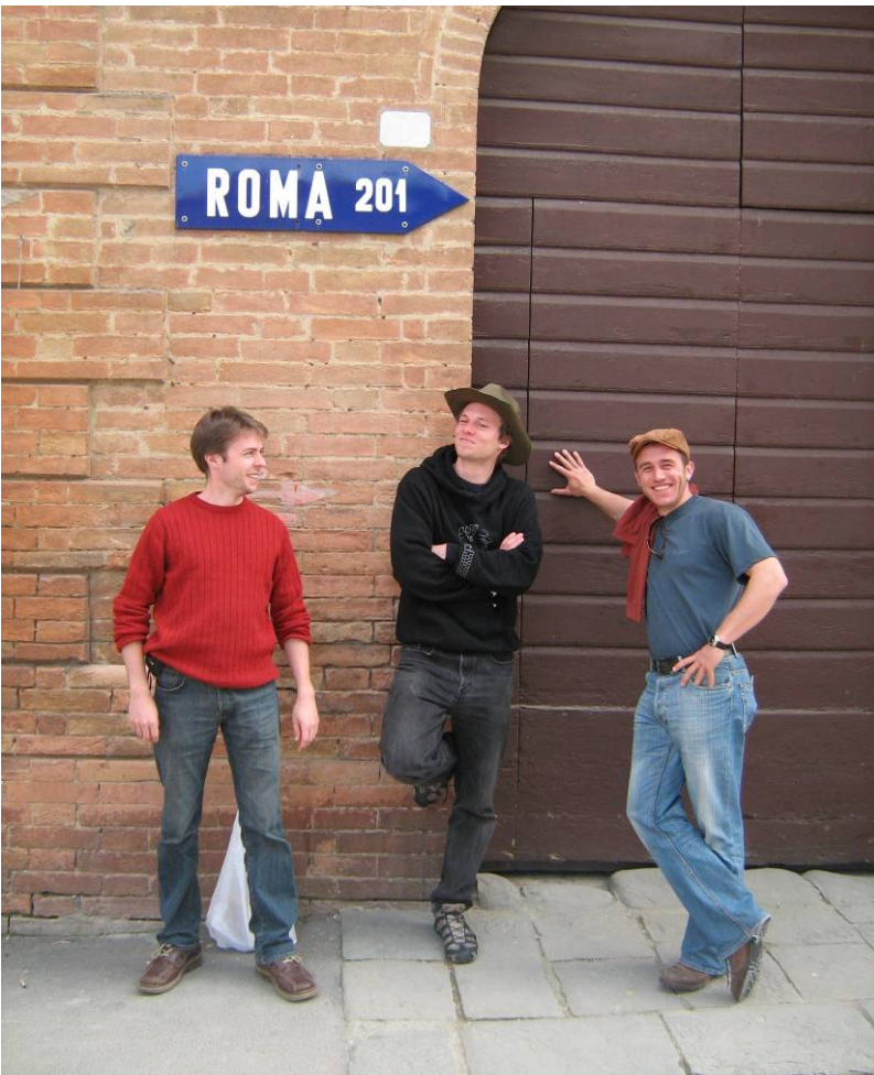
Nun geht's wieder nach Hause aber das ist die falsche Richtung