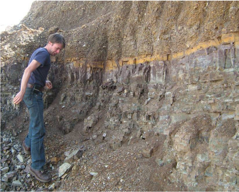
Auch in der Toskana gibt es Geologie