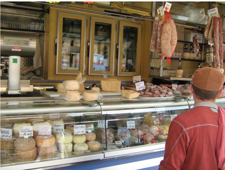
Spezialitäten aus der Toskana