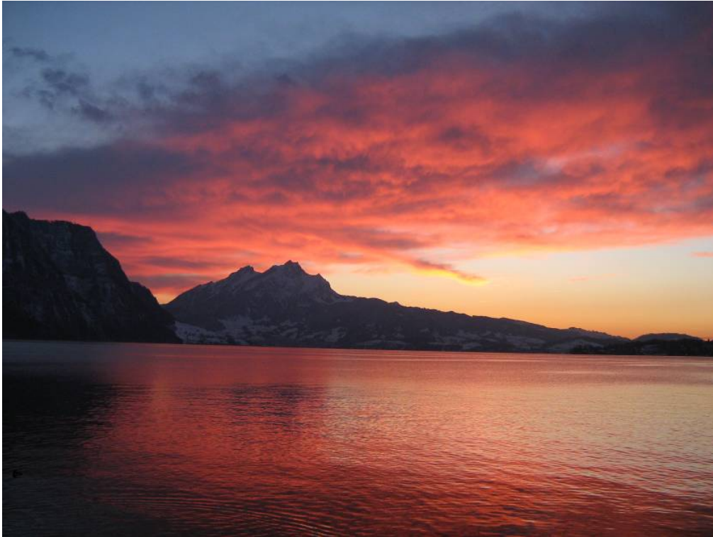
Weggis – Büro – Ade!!!