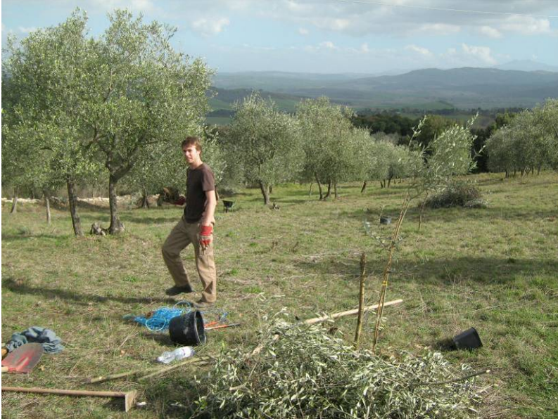
Peer beim Oliven schneiden