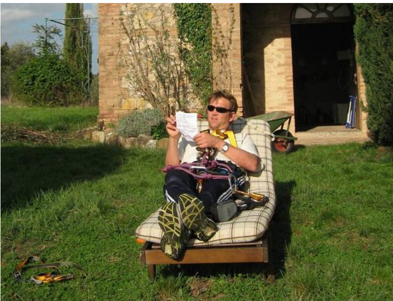
Studium der Kletteranweisungen