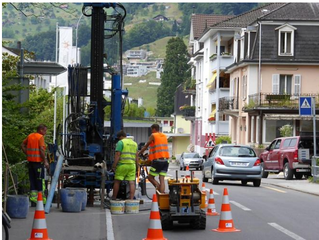
Sondierbohrung B2. Aufgrund der Lage direkt auf der KS wurde der Verkehrsdienst aufgeboten.

Das Hauptaugenmerk lag in der Ermittlung der Fundamentverhältnisse im Bereich der Altdorfbachbrücke sowie der Trottoirauskragung.